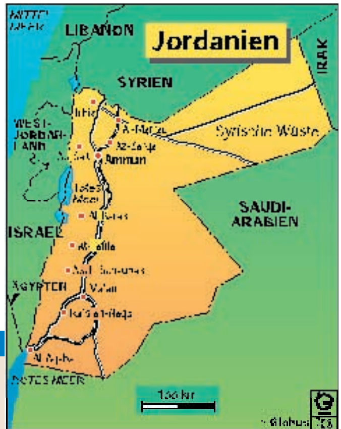
Abb. 1: Im „Brennpunkt Nahost“: Königreich Jordanien

Die Ausstattung eines Rettungswagens wird nicht nur durch medizinische Notwendigkeiten bestimmt. Auch Faktoren wie die geografische Lage des Einsatzgebietes, das Klima, die Kultur, die Geschichte, die Infrastruktur sowie die Wirtschaftssituation können Einfluss auf die RTW-Ausstattung haben. Im Rahmen eines Promotionsvorhabens wird vom Verfasser die Ausstattung des Rettungswagens aus Sicht der Arbeitswissenschaft am Beispiel der Länder Deutschland, Israel, Jordanien und Palästina untersucht und verglichen. Vor diesem Hintergrund wurde bei einem Vor-Ort-Termin in Jordanien die Ausstattung der dortigen Rettungswagen untersucht und dokumentiert. Des Weiteren konnten dabei interessante Details des jordanischen Rettungssystems in Erfahrung gebracht werden.