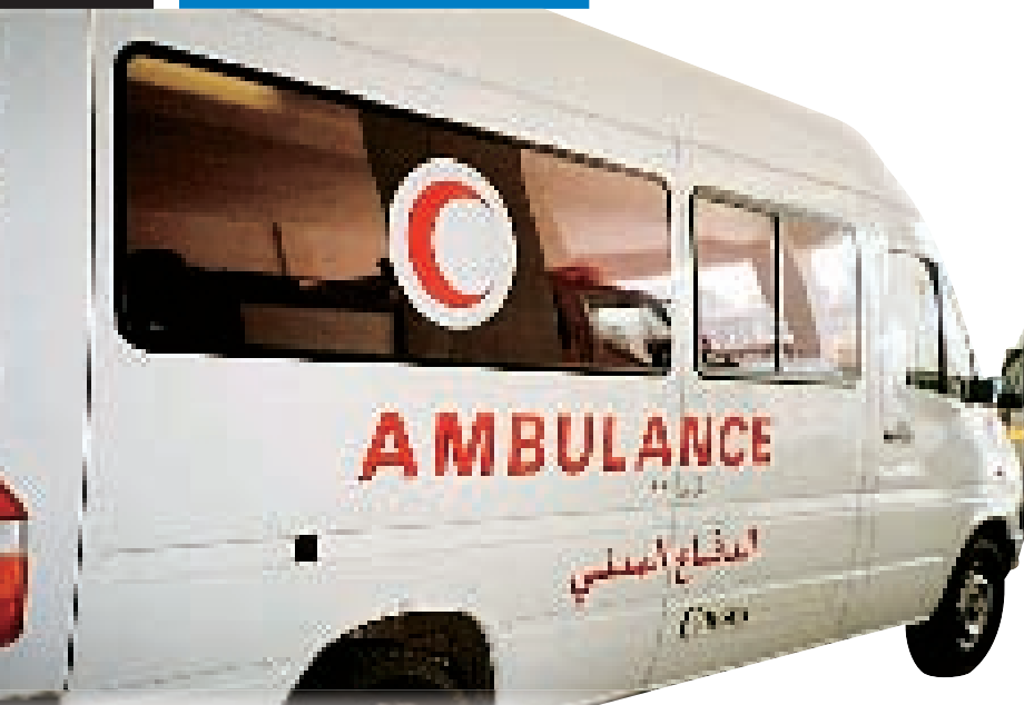
Abb. 5: Außenansicht eines RTW der „Civil Defense“

Notfallrettung → Der Notruf kann von jedem Telefon aus kostenlos über „199“ betätigt werden. Bei ca. 80% der Notfallanrufe durch die „199“ handelt es sich um kranke Personen (keine Unfälle usw.). Es gibt keine exakten Statistiken, die die Krankheitsbilder bzw. die Beschwerden darstellen.