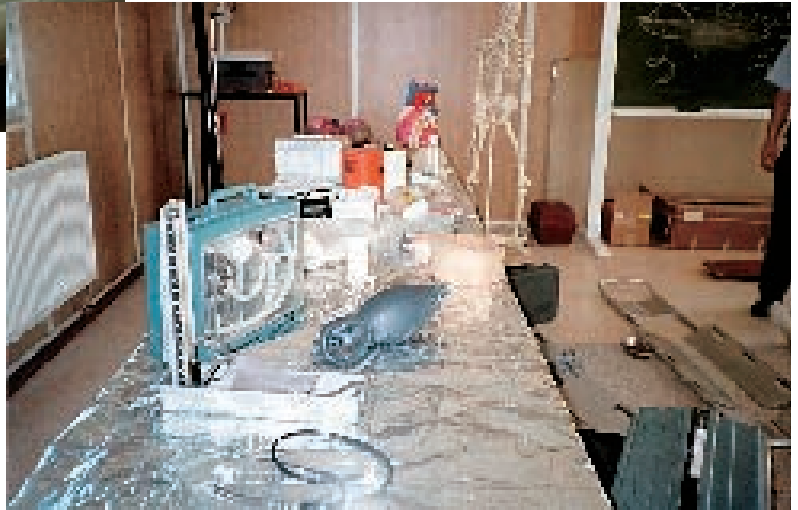
Abb. 3: Im Schulungszentrum der jordanischen „Civil Defense“

verbirgt sich der einzige öffentliche Rettungsdienst in Jordanien. Obwohl die privaten Krankenhäuser in Jordanien über Rettungswagen verfügen, kommen sie aufgrund der hohen Kosten für den Patienten so gut wie nie zum Einsatz. Diese Rettungswagen dienen dazu, Patienten innerhalb des eigenen Krankenhauses zu verlegen, nach Hause zu fahren oder den Transport zwischen den unterschiedlichen Krankenhäusern zu sichern.